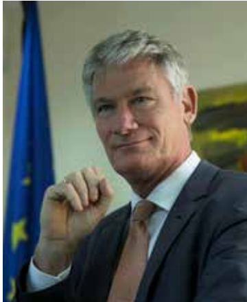
ဥရောပ၏ မိတ်ဆွေများခင်ဗျာ

ဤ WhiteBook သည် ဥရောပရင်းနှီးမြှုပ်နှံသူများအတွက်မြန်မာနိုင်ငံ၏လက်ရှိအခင်းအကျင်းနှင့်ပတ်သက်၍ ပိုမိုကျယ်ပြန့်သော သဘောထားအမြင်တစ်ရပ်ကိုပေးစွမ်းနိုင်လိမ့်မည်ဟုကျွန်တော်တို့ယုံကြည်ပါသည်။ EuroCham Myanmar၏ ဘက်စုံဖွံ့ဖြိုးတိုးတက်မှုသည် ဥရောပရင်းနှီးမြှုပ်နှံသူများအနေဖြင့် မြန်မာနိုင်ငံအပေါ် အင်မတန်စိတ်ဝင်စားမှုရှိကြောင်းပြသနေသော ပြယုဒတစ်ခုပင်ဖြစ်ပါသည်။ ကျွန်တော်တို့အဖွဲ့ဝင်များအားလုံးသည် မြန်မာနိုင်ငံ၊ မြန်မာနိုင်ငံသားများနှင့် ဥရောပရင်းနှီးမြှုပ်နှံသူများအားအကျိုးရှိစေမည့်ပိုမိုကောင်းမွန်သောစီးပွားရေးအလေ့အကျင့်များပြန့်ပွားလာစေရေး အင်တိုက်အားတိုက် လုပ်ဆောင်သွားမည်ဖြစ်ပါသည်။စင်စစ်အားဖြင့် ရင်းနှီးမြှုပ်နှံသူများသည် တိုင်းပြည်အတွက် ရေရှည်တန်ဖိုးတစ်ခုဖန်တီးရန်ရည်ရွယ်ကြသည့်အားလျော်စွာကျွန်တော်တို့သည်လူတိုင်းပါဝင်သော ဖွံ့ဖြိုးတိုးတက်မှု၊ ငြိမ်းချမ်းရေး နှင့် သာယာဝပြောရေးကို အထောက်အကူပေးနိုင်ရန် အစွမ်းကုန် ကြိုးပမ်းသွားကြမည်ဖြစ်ပါသည်။